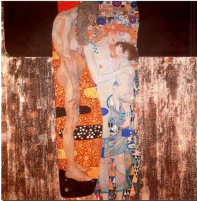
Las tres edades de la mujer. Klimt